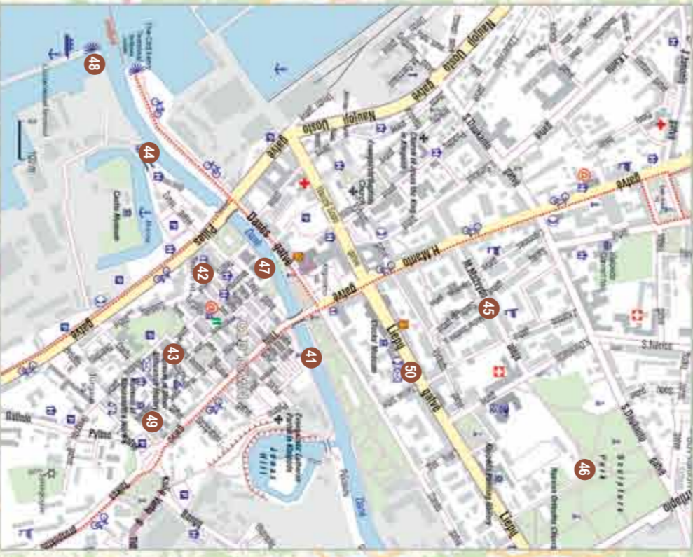
SUTARTINIAI ŽENKLAI / LEGEND